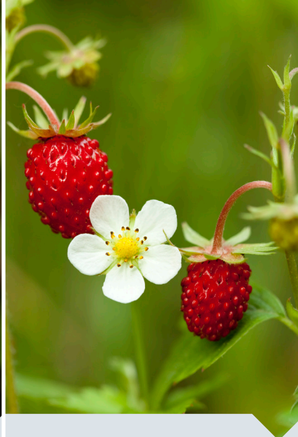
bosaardbei Fragaria vesca