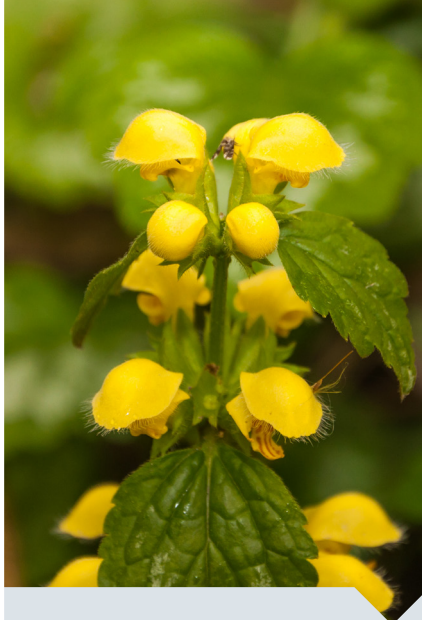
gele dovenetel Lamiastrum galeobdolon