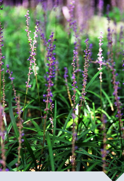
leliegras Liriope muscari